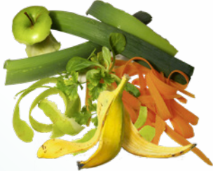
Épluchures de fruits et légumes